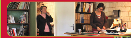
6 cm x 2 cm à 300 dpi

http://www.azurs.net/photoblog/convertisseur-dpi-pixels-taille-image.html